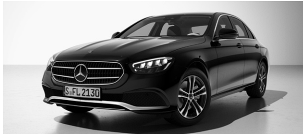
E-Klasse, AVANTGARDE Exterior (P33)