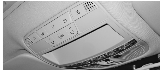
E-Klasse, Taxameter-Halterung in Dachbedieneinheit (336)