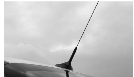
E-Klasse, Dachantenne für Sprechfunk und Vermittlung (Telefon und GPS) (356)