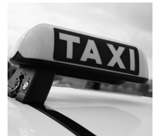
E-Klasse, Einarm-Taxi-Dachzeichen (341)