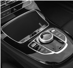
E-Klasse, Zubehörgeräte-Halterung in Mittelkonsole (333)