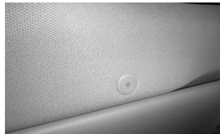
E-Klasse, Funkfreisprechanlage-Vorrüstung, Funkmikrofon (938)