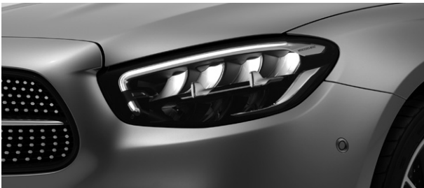
E-Klasse, LED High Performance-Scheinwerfer (632)