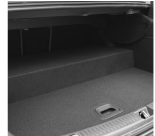
E-Klasse E 300 de Limousine (Hybrid), Kofferraum